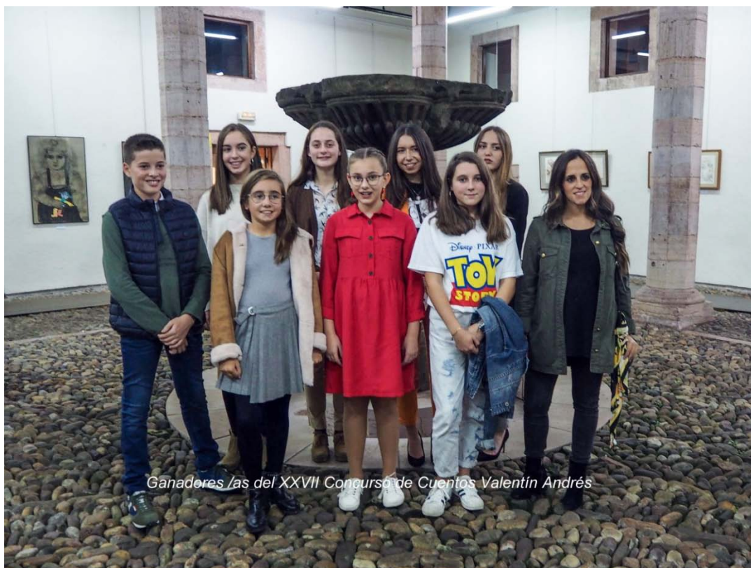
Ganadores/as del XXVII Concurso de Cuentos Valentín Andrés

Los patrocinadores y colaboradores de este certamen, así como los miembros de la Mesa fueron los encargados de realizar el acto de entrega de galardones a los autores y las autoras cuyos relatos fueron dictaminados como tal por los distintos jurados de las tres categorías del Concurso.