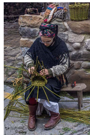
Making baskets https://www.pinterest.es/pin/659073726687597440/