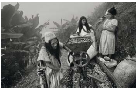
La vuelta a los mundos del café https://plus.google.com/100628697693801761913

Comenzó con 15 años en la fotografía analógica (química), primero en blanco y negro; más tarde pasó al color y a la fotografía digital, aunque alternando ambas entre 1997 y 2003.